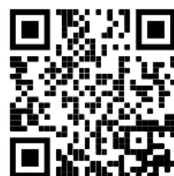
Weg & Spoorwegen