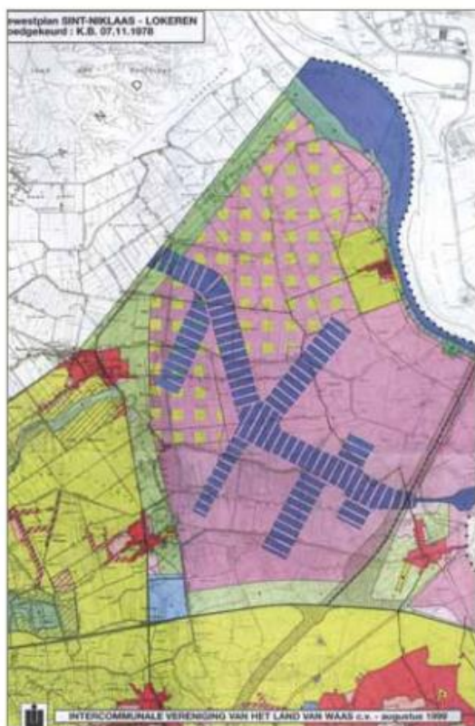
Fig. 2 GEWESTPLAN 1978

Het gewestplan uit 1978 was de vertaling van het technische havenplan, met een Kallosluis en een kanaaldok richting Baalhoek. Merkwaardig daarbij was dat men, naast de enclave Doel, het gebied had opgedeeld in twee zones: het eigenlijke havengebied - waarvan de noordelijke grens zowat een verbindingslijn vormde tussen Verrebroek en Doel, en het havenuitbreidingsgebied daarboven.